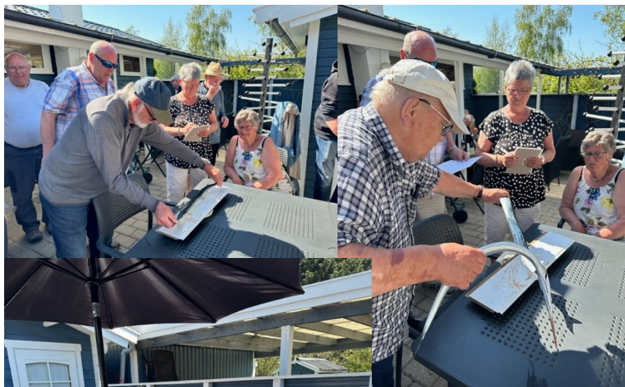
Vinderfisken og fangeren